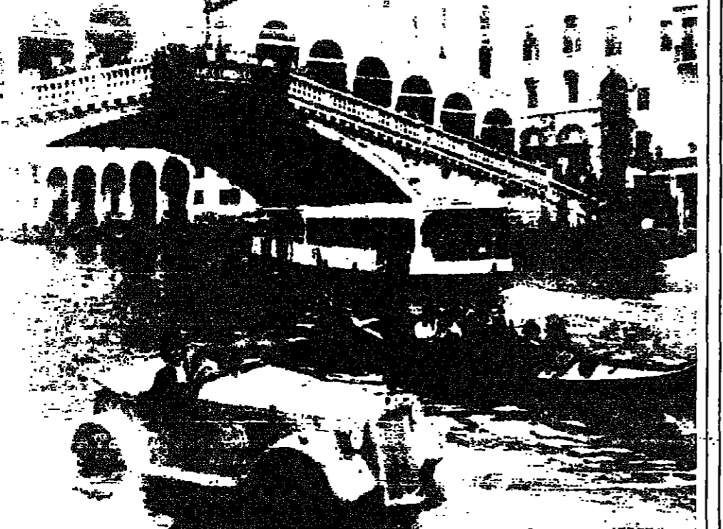
... وللوارب كرفالها في مدينة البندقية، فقد شهدت اقنية هذه المدينة في الرابع من الشهر الجاري تظاهرة حاشدة شاركت فيها قوارب مبتكرة، عمد اصحابها الى اعتماد الاشكال الغربية، فسارت سيارة الجاغوار الخشبية الى جانب الغنول التقليدي البندقية.